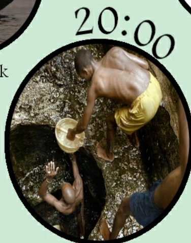
Studna - Hlas z Etiopie