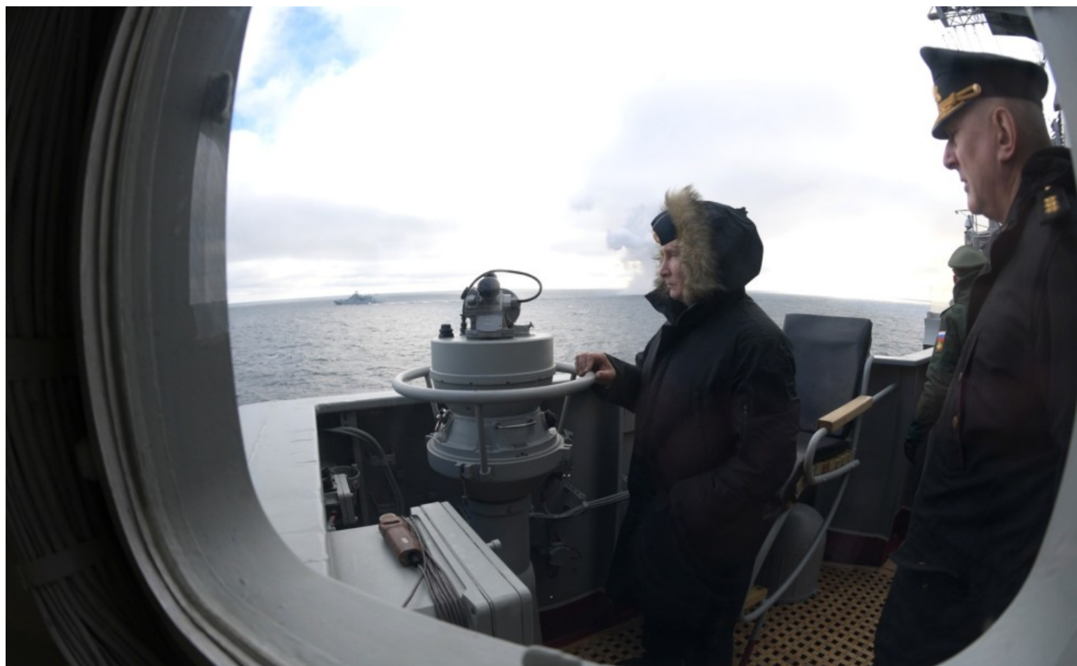
Vrchní velitel ruských ozbrojených sil Vladimir Putin řídil v roce 2020 cvičení Černomořské flotily.

Zatím ne. Také se zatím náš prezident, vrchní velitel ozbrojených sil, chová dost liberálně.